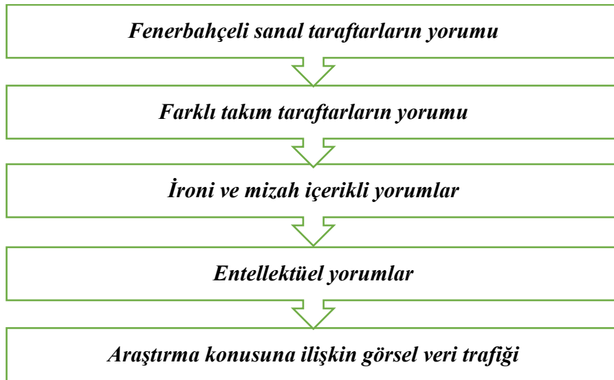
Őekil 1. Arařtırma problemi iř akıř Őeması